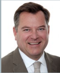
Josef Schmid 2. Bürgermeister und Leiter des Referates für Arbeit und Wirtschaft

IT- und Industrieunternehmen sind in Deutschland tragende Säulen der Wirtschaft. Die Digitalisierung aller Lebens- und Wirtschaftsbereiche stellt diese Unternehmen allerdings vor große Herausforderungen. Um sich diesen stellen zu können, bedarf es u. a. eines soliden Standortes, des Willens zur Veränderung und auch passender Partner.